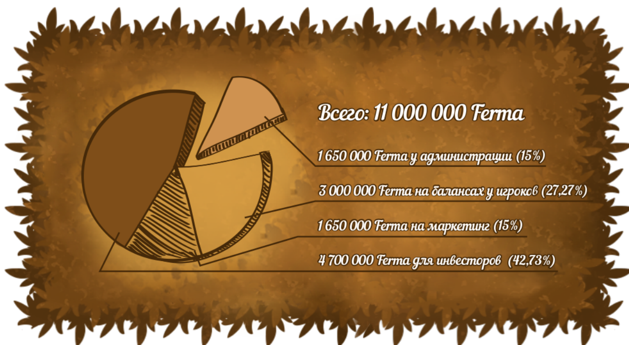
Схема 2. Токеномика

FERMA — собственный токен игры. Реализован на основе Binance Smart Chain (BSC), сети блокчейн с поддержкой смарт-контрактов. Торгуется на P2PB2B и на внутренней бирже. Токен FERMA можно обменять на внутриигровую валюту (FSR), BTC, RUB и USD. В игре токен используется для покупки полей, животных, загонов, лицензий на производство продуктов и как вознаграждение за серфинг по рекламным ссылкам, по курсу внутренней биржи. Всего в обращении 11 млн токенов.