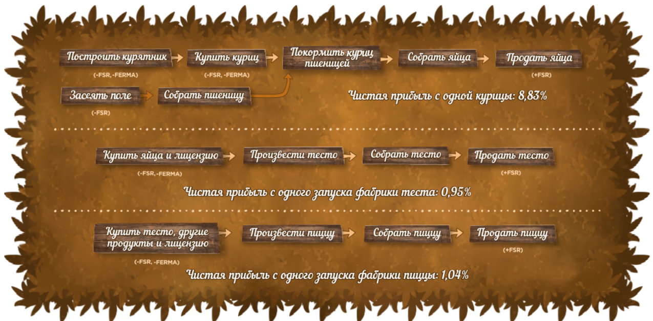
Схема 3. Использование токена в игре, пример на кур